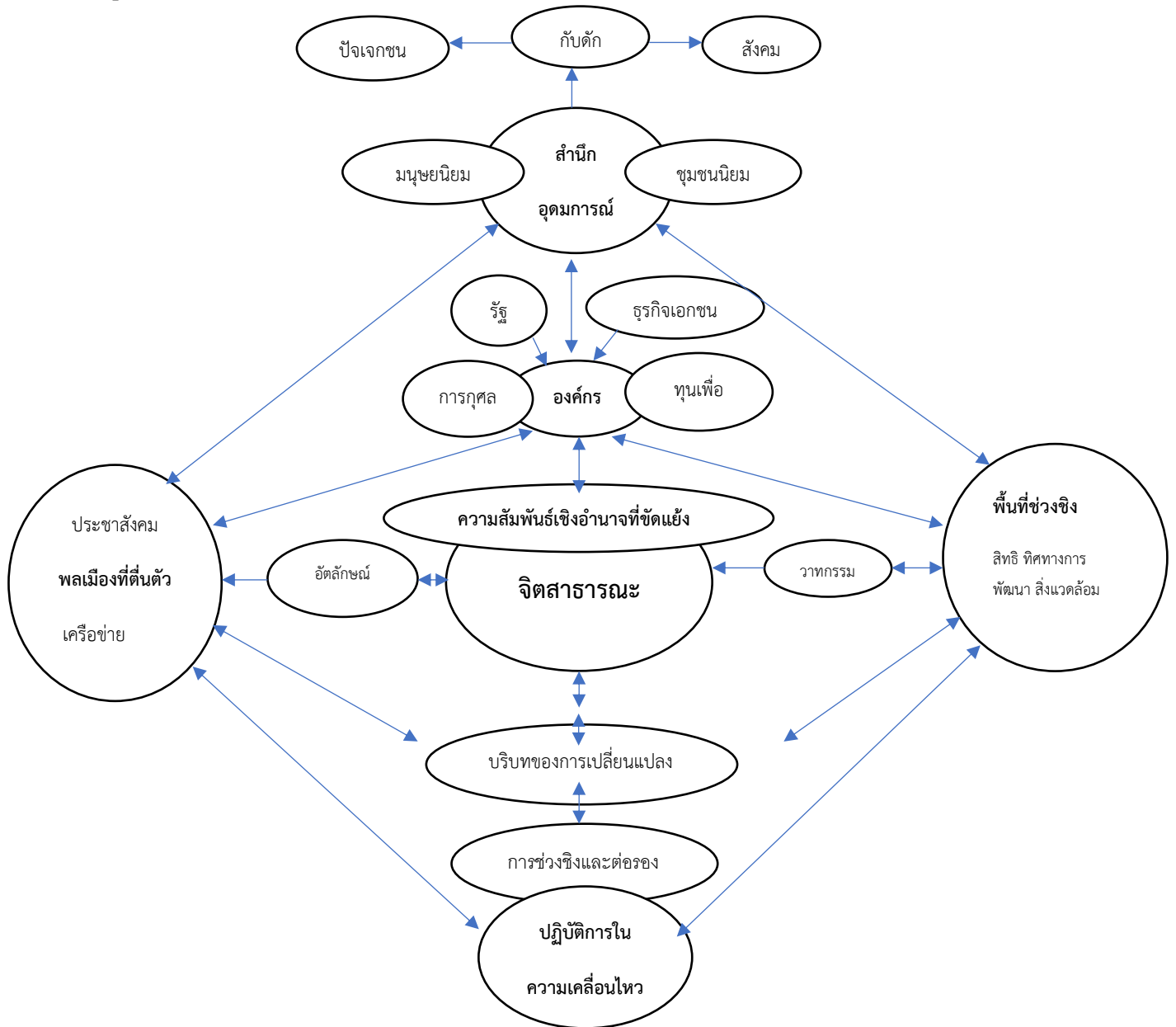
แผนภูมิที่ 2 จิตสาธารณะในพื้นที่ช่วงชิงความหมาย

ในพื้นที่ช่วงชิง ทั้งสิทธิ ทิศทางการพัฒนา และการมีส่วนร่วมในการจัดการสิ่งแวดล้อม ในบทความที่ 4 มีกรณีศึกษามากมายเกี่ยวกับการเคลื่อนไหวทำนองนี้ แต่ยังขาดการวิเคราะห์แต่ละกรณีเหล่านั้นให้เห็นความเชื่อมโยงตามแนวทางที่ได้แสดงไว้แผนภูมิที่ 2 ได้ โดยเฉพาะการเผยให้เห็นถึงกระบวนการของการสร้างพื้นที่ที่สาม ซึ่งสามารถใช้เป็นจุดเน้นของการศึกษาเชิงวิเคราะห์ได้อย่างดี